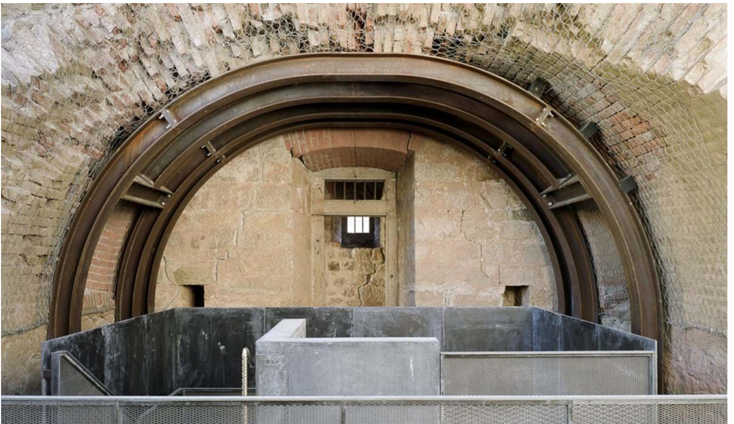
Chemollo, © Chemollo