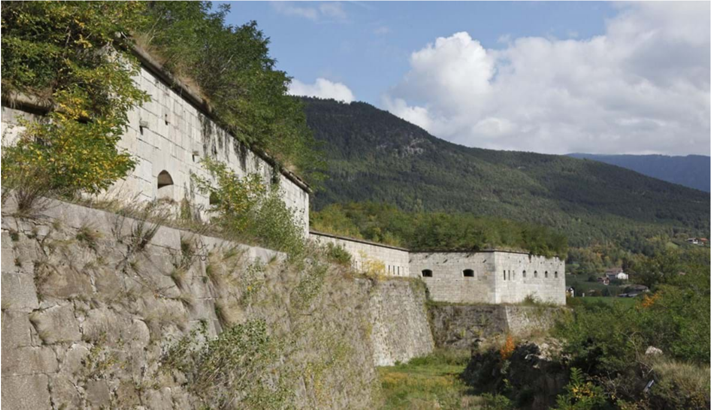
Florian Mohn