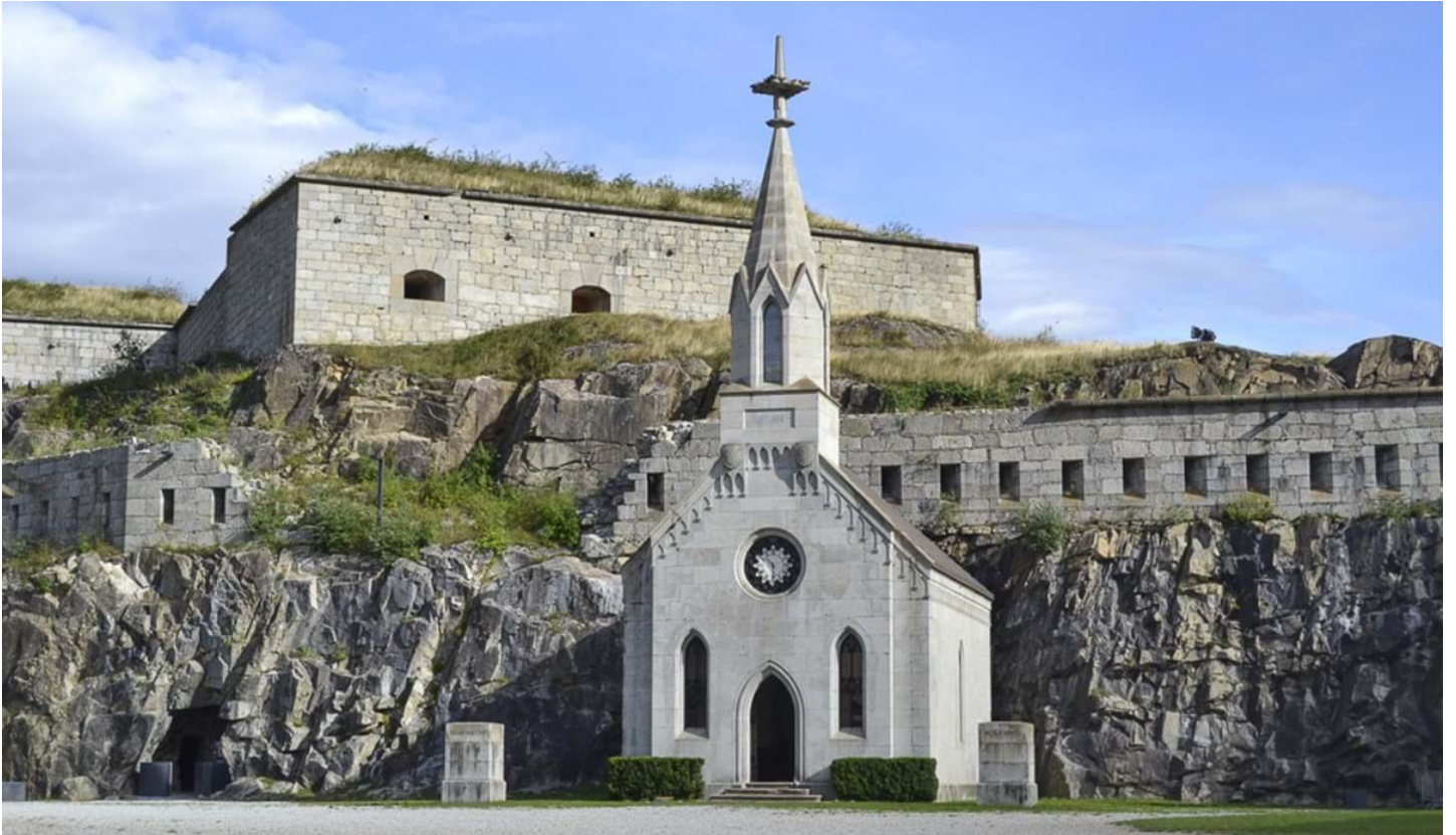
Marco Ottaviani, © Marco Ottaviani