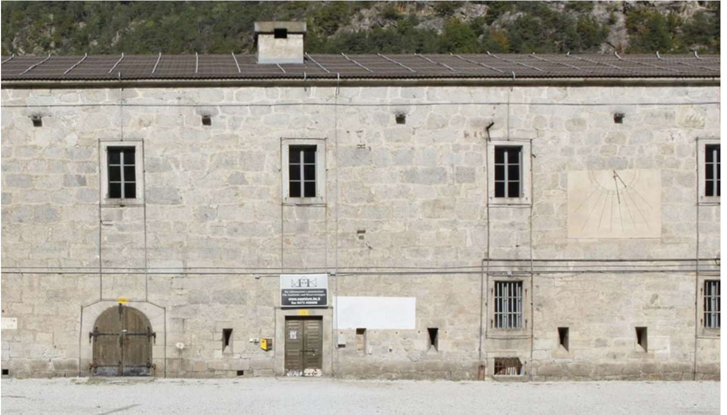
Florian Mohn, © Florian Mohn