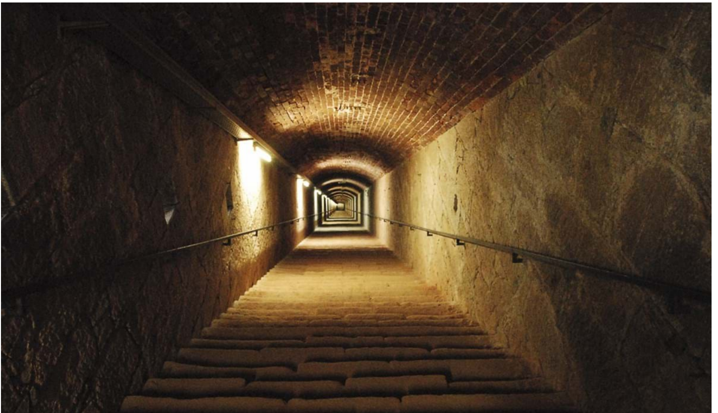
Andrea Pozza, © Andrea Pozza