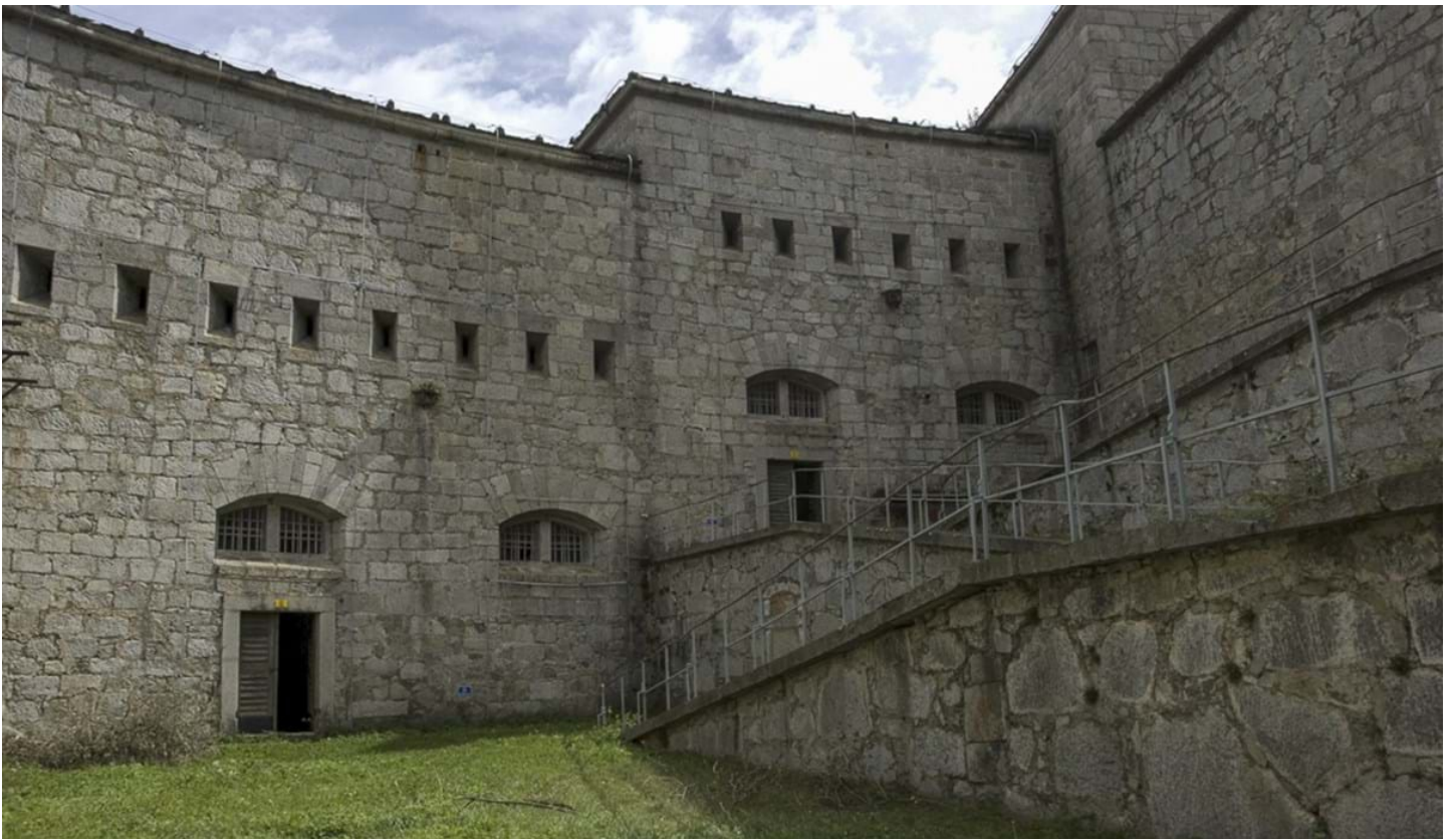
Andrea Pozza, © Andrea Pozza