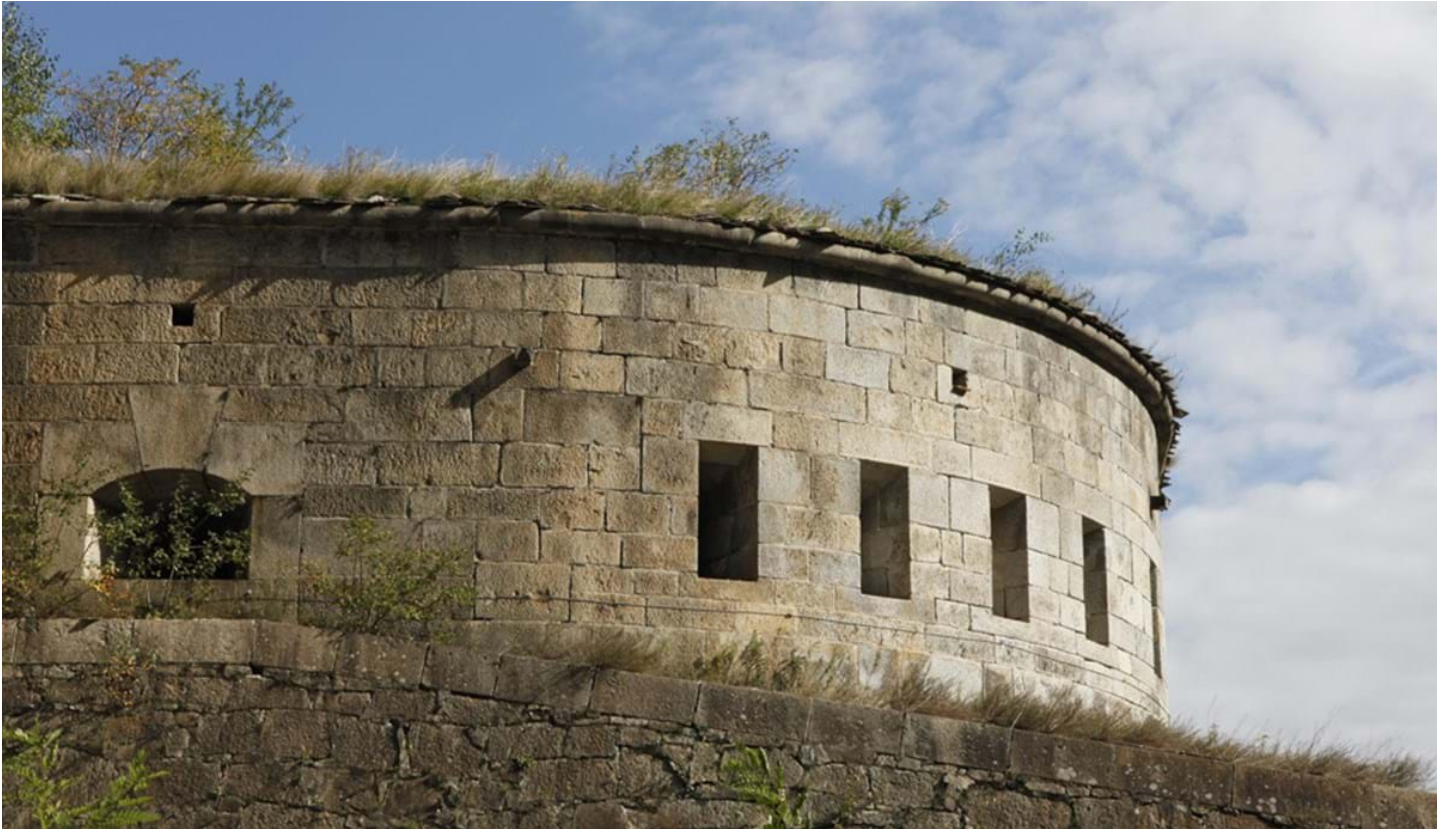
Florian Mohn, © Florian Mohn