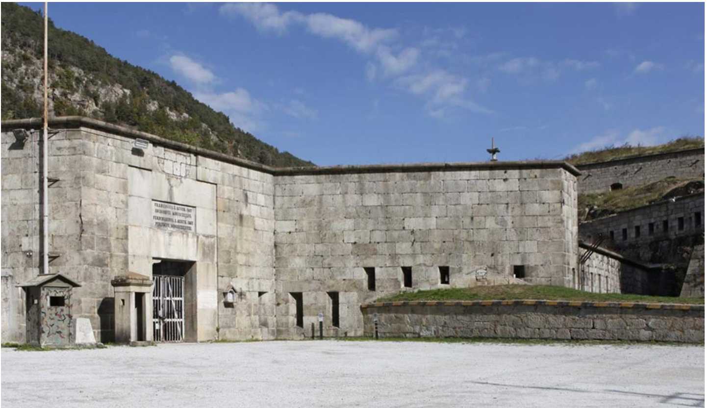
Florian Mohn, © Florian Mohn