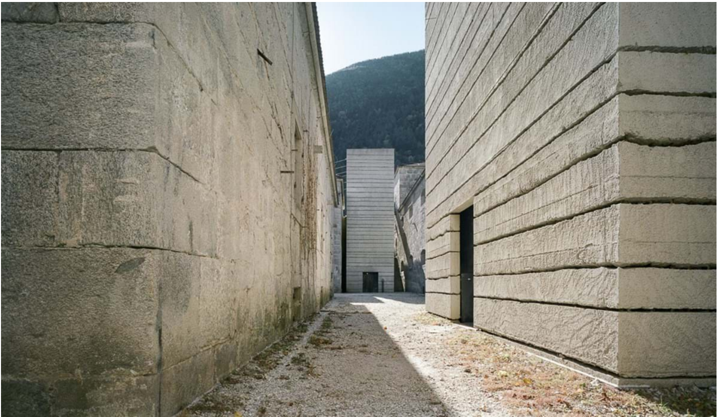
Chemollo, © Chemollo