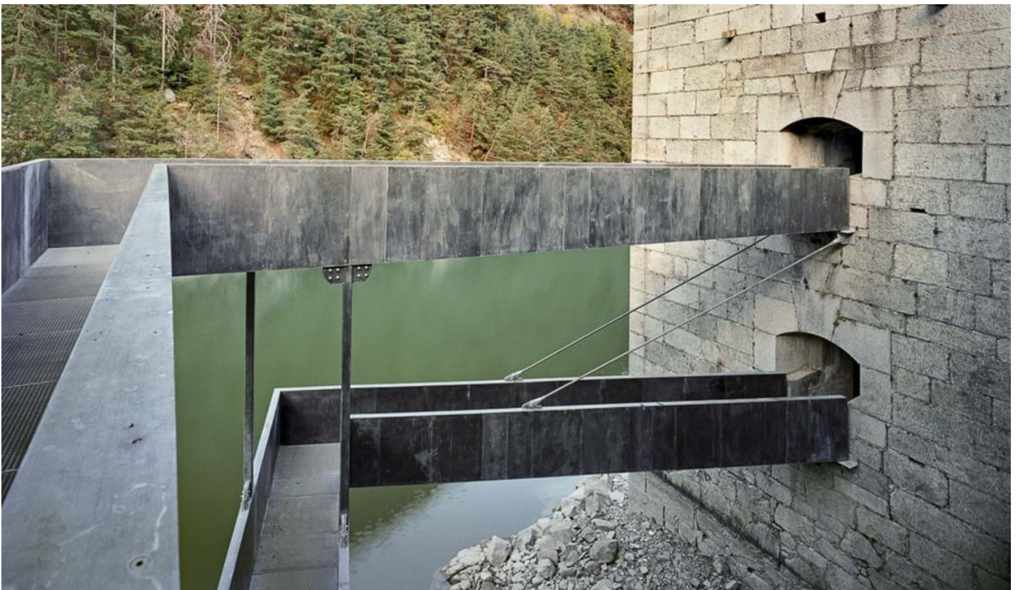
Chemollo, © Chemollo