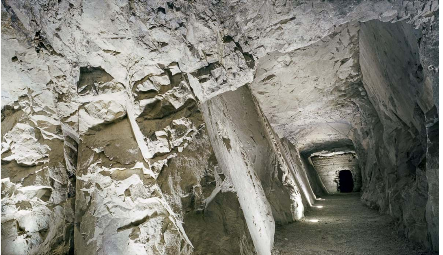
Chemollo, © Chemollo