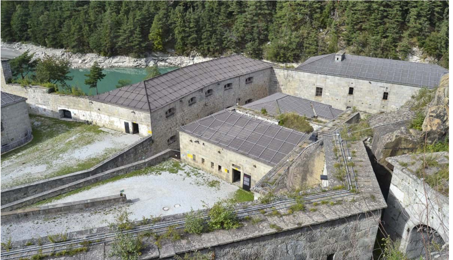
Marco Ottaviani, © Marco Ottaviani