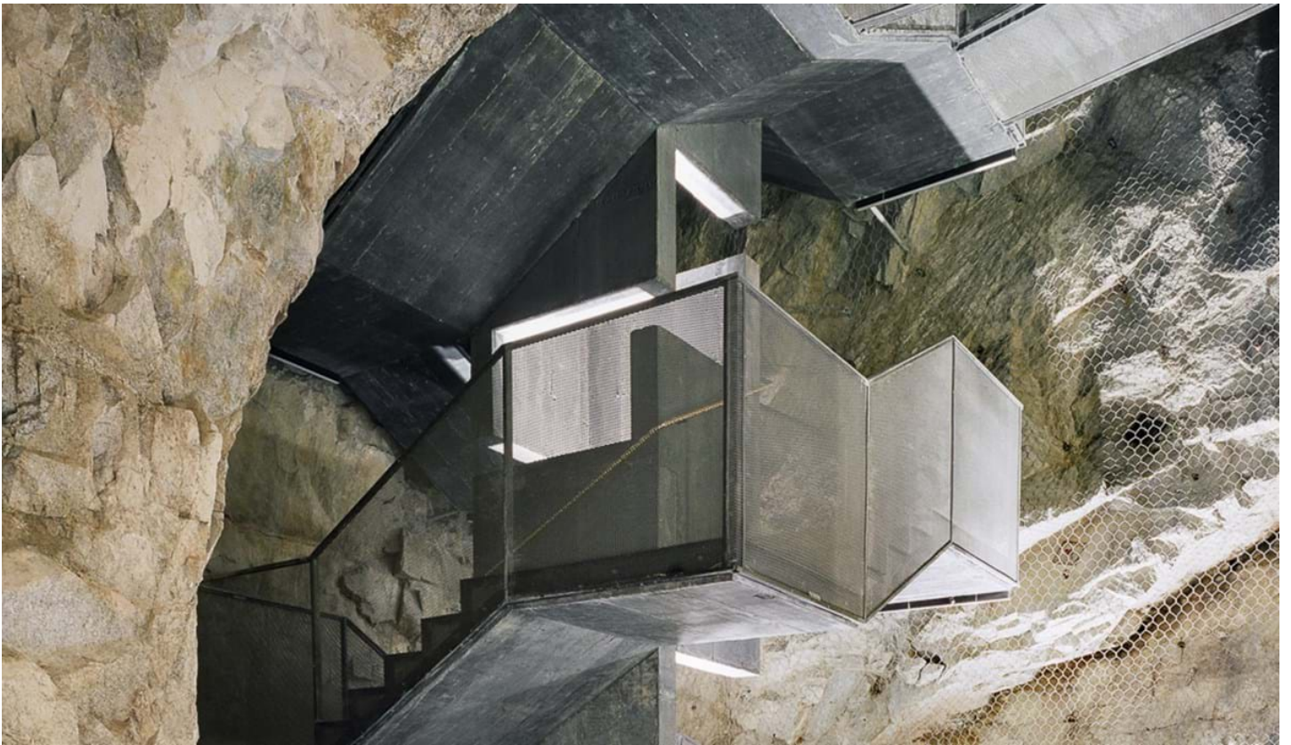
Chemollo, © Chemollo