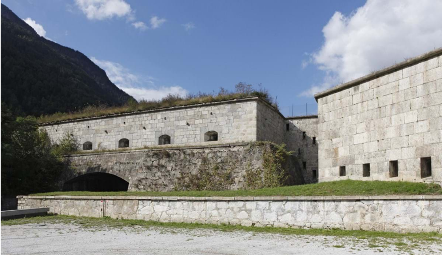
Florian Mohn, © Florian Mohn