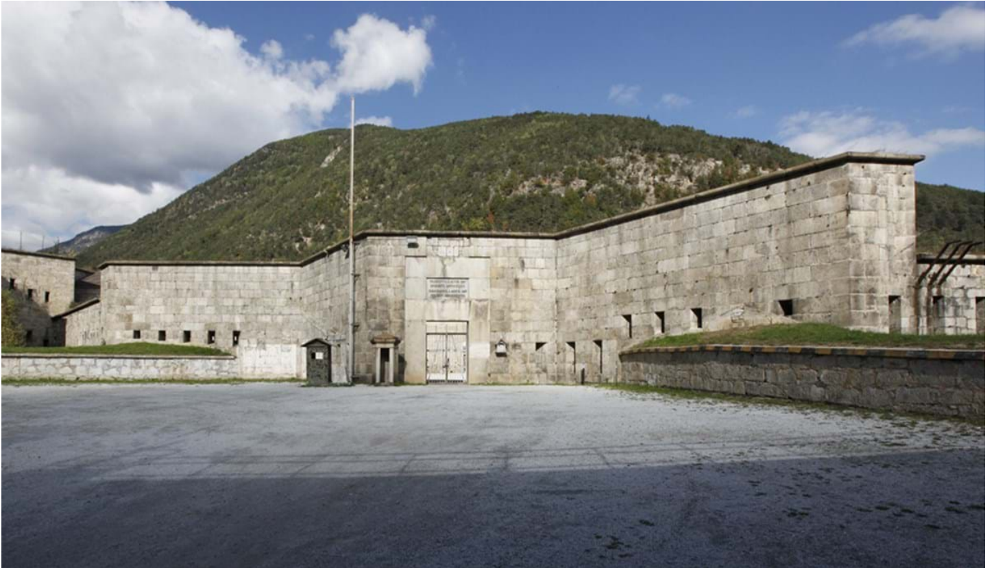
Florian Mohn, © Florian Mohn