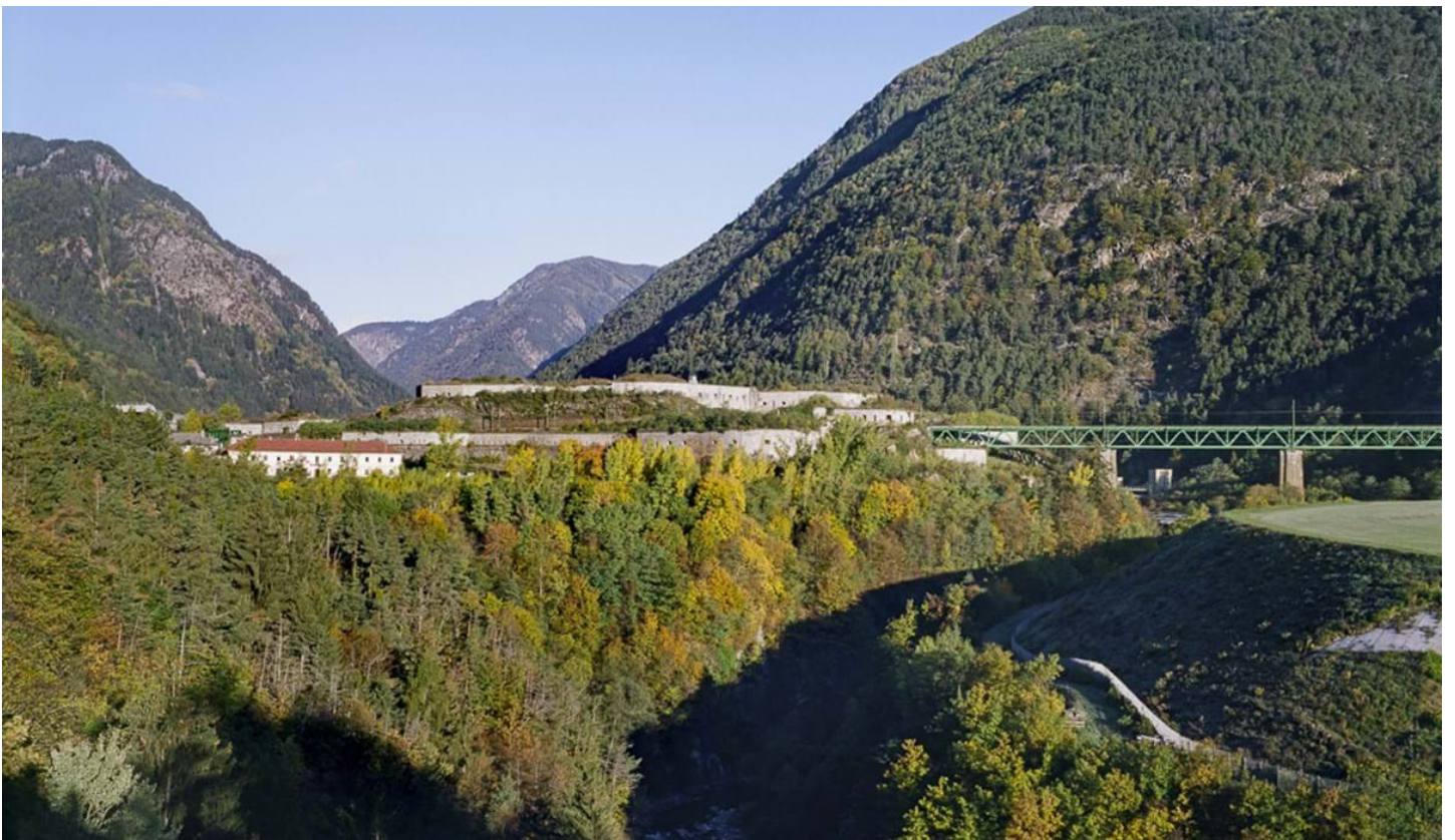
Chemollo, © Chemollo