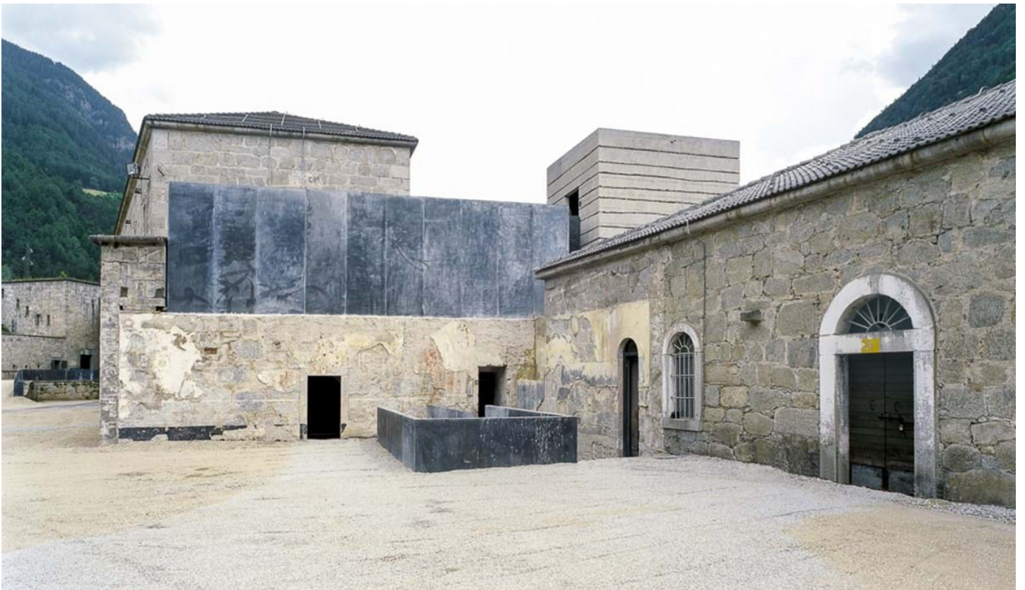
Renä Riller, © Renä Riller