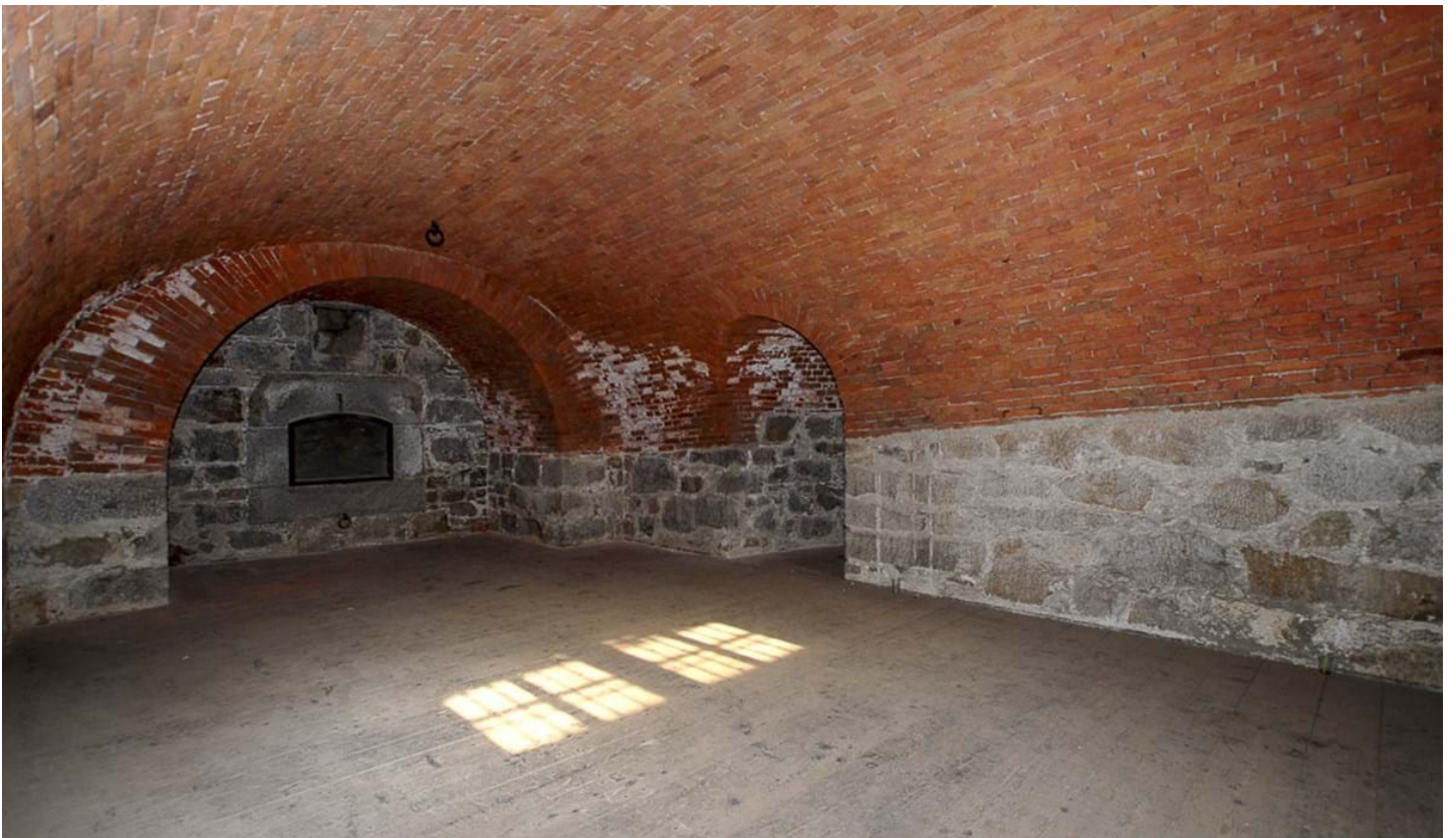
Andrea Pozza, © Andrea Pozza