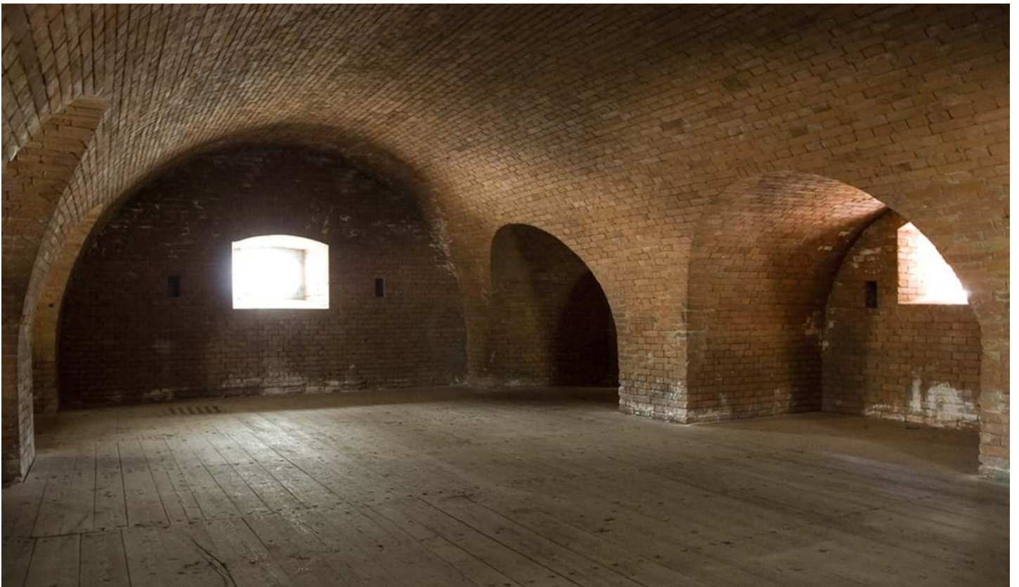
Andrea Pozza, © Andrea Pozza