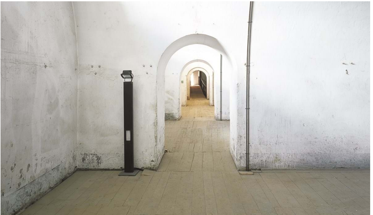
Renä Riller, © Renä Riller