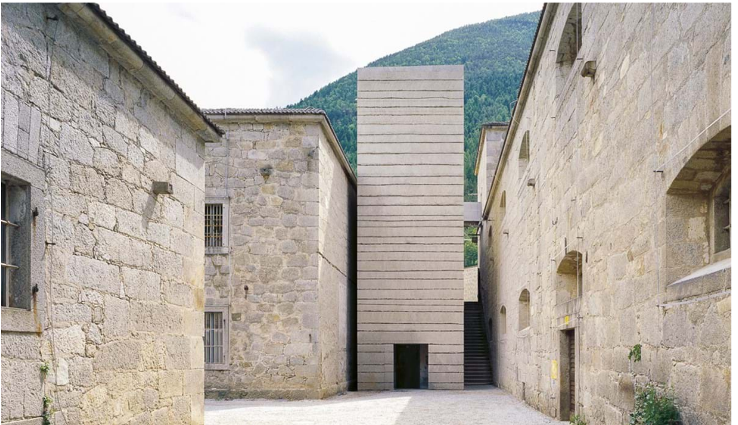
Renä Riller