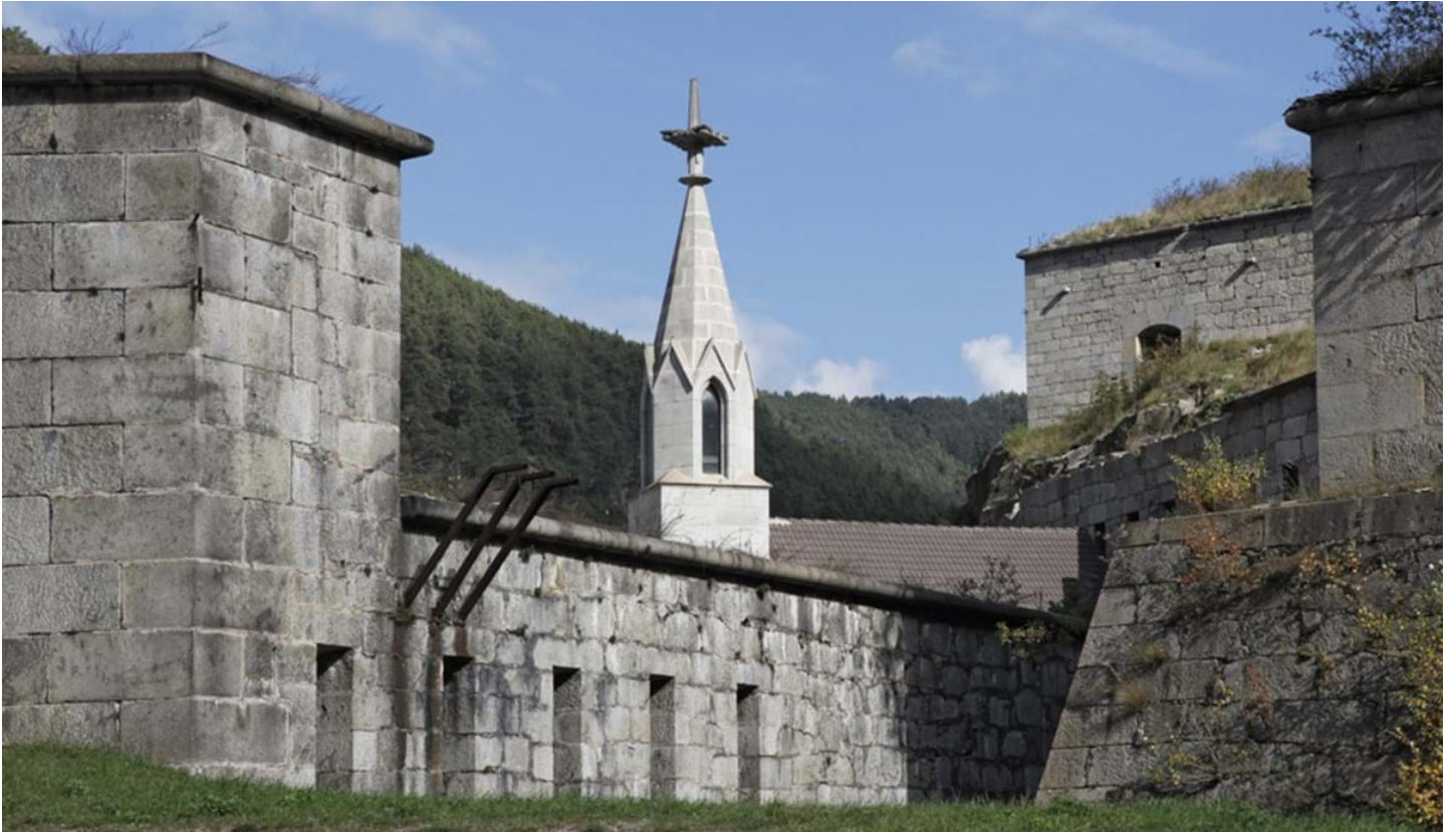
Florian Mohn, © Florian Mohn