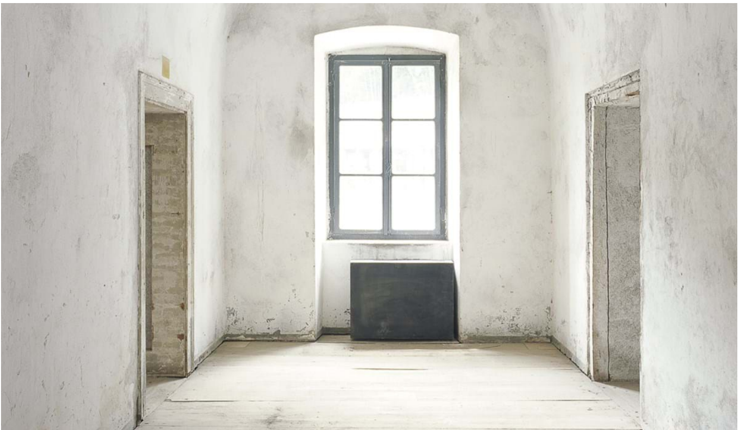
Renä Riller, © Renä Riller