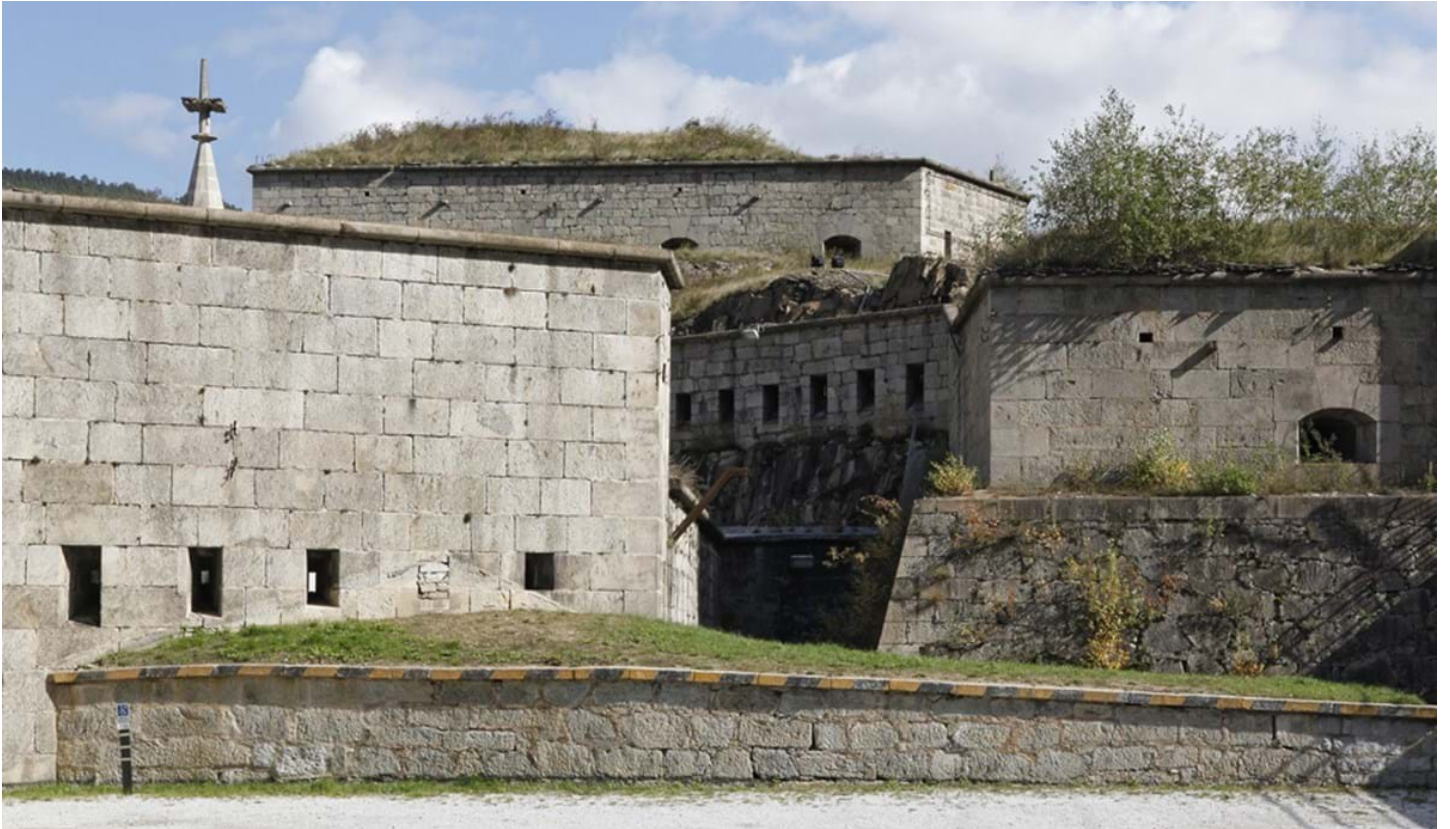
Florian Mohn, © Florian Mohn