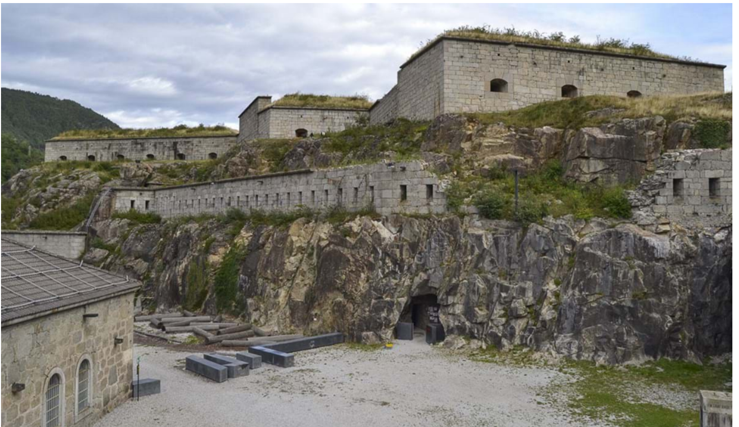
Marco Ottaviani, © Marco Ottaviani