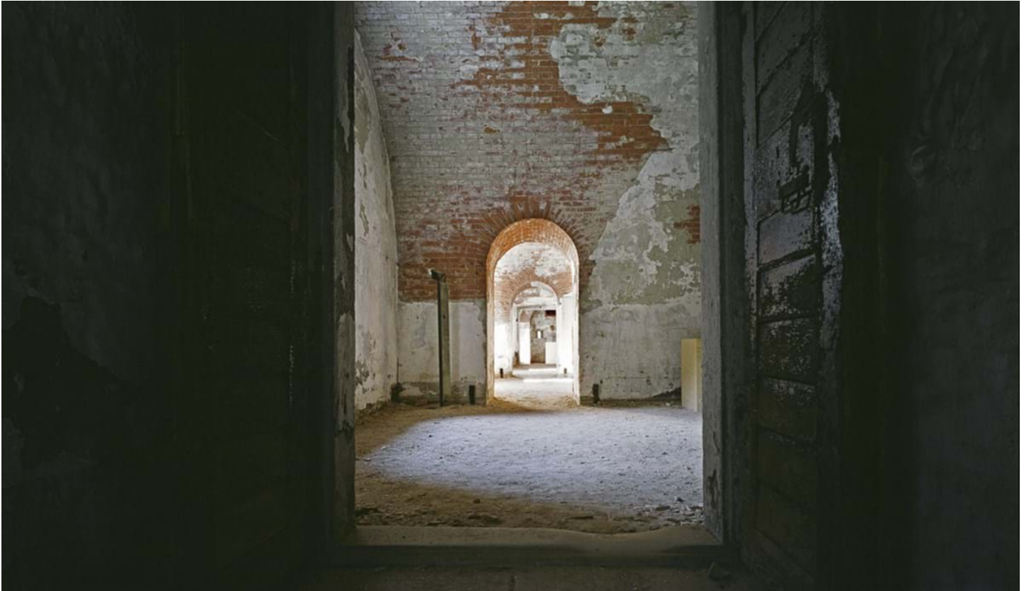
Chemollo, © Chemollo