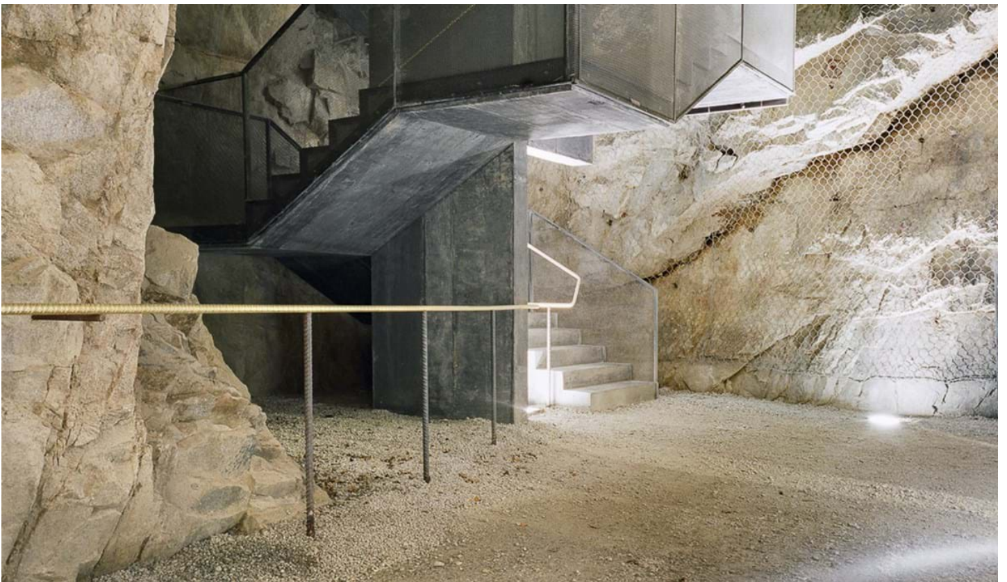
Chemollo, © Chemollo