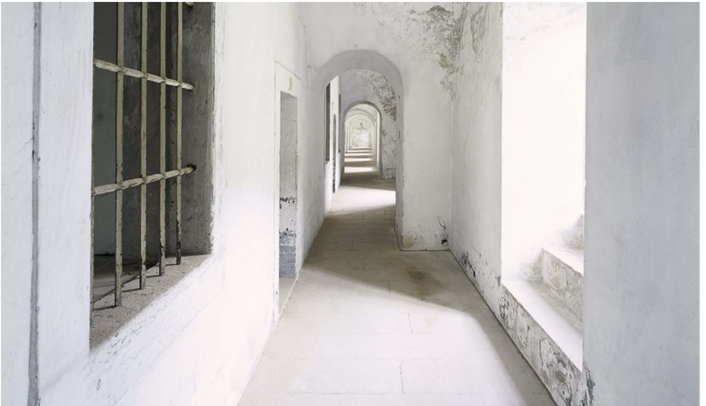
Renä Riller, © Renä Riller