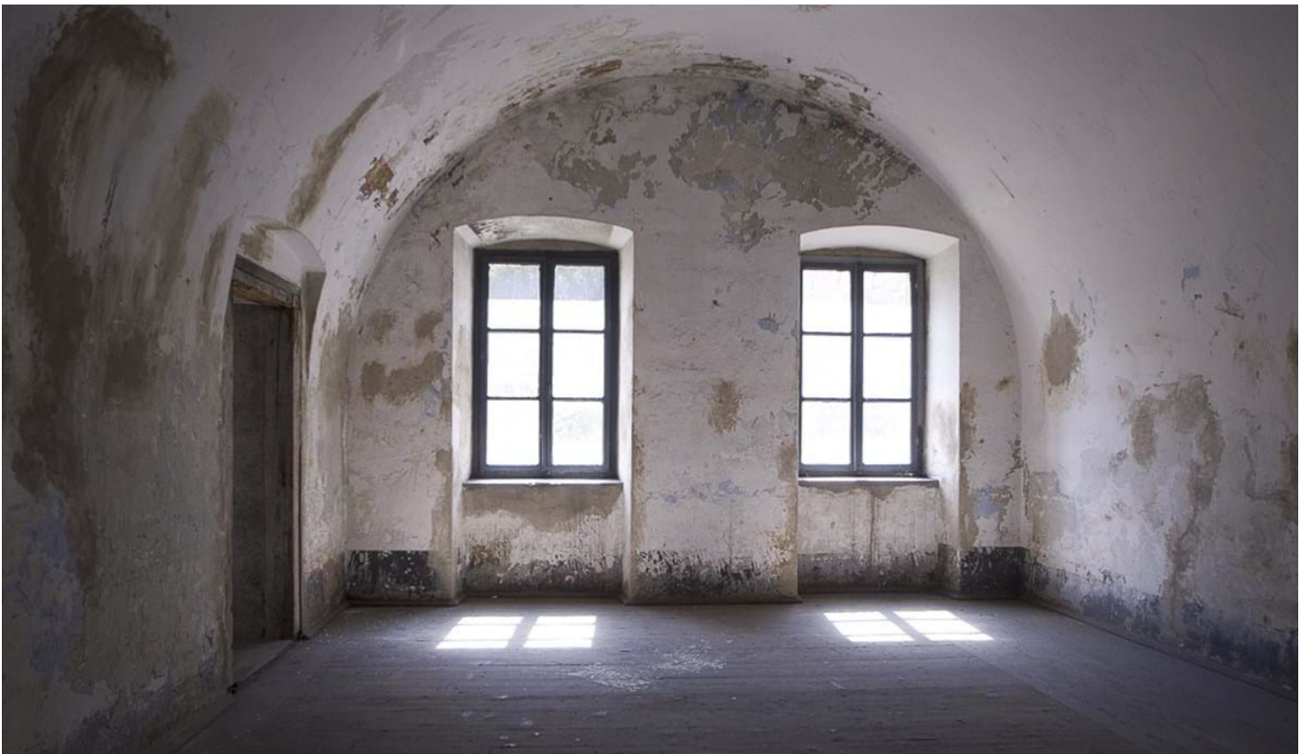
Andrea Pozza, © Andrea Pozza