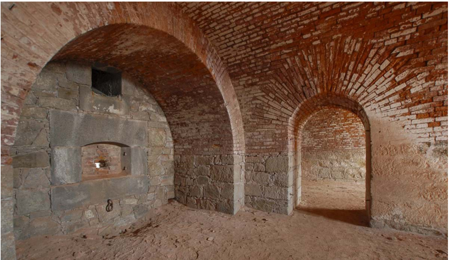
Andrea Pozza, © Andrea Pozza