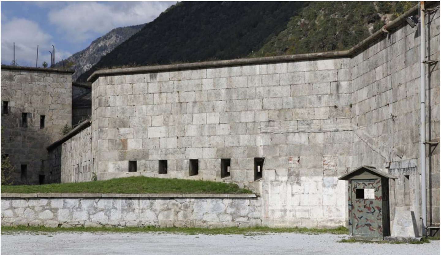
Florian Mohn, © Florian Mohn