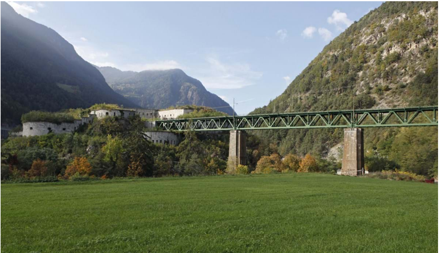
Florian Mohn, © Florian Mohn