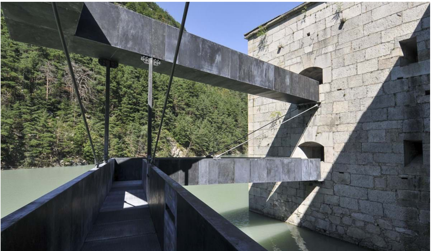
Andrea Pozza, © Andrea Pozza